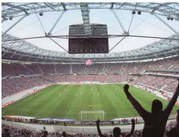
Das Verzinken von hochfesten Stahlsorten erfordert eine richtige Zinklegierung.