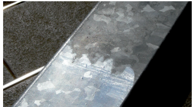
Mit GalvaSeal behandelte Teile erhalten den Glanz (unten GalvaSeal, oben unbehandelt nach 15 Monaten in der Witterung)