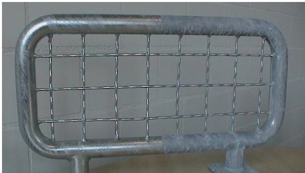
GalvaSeal schützt vor Weissrost und erhält den Glanz der frischen Verzinkung

Der Glanz von frisch feuerverzinkter Ware bleibt je nach Witterung nicht lange erhalten und oft bildet sich nach kurzem eine graue oder weisslich-matte Patina. Dies kann durch Lagerung unter Dach reduziert werden, jedoch wird die Oberfläche in jedem Fall mit der Zeit matt. Bei manchen Konstruktionen ist eine lang anhaltende, glänzende Zinkoberfläche schön und wünschenswert.