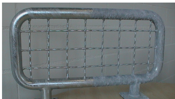
GalvaSeal protège les objets récemment zingués à chaud contre la rouille blanche et préserve leur éclat.

Les matériaux récemment zingués à chaud gardent plus ou moins longtemps leur éclat en fonction du climat auquel ils sont exposés. Souvent, une patine de couleur grise ou blanchâtre mate se forme assez rapidement. L'entreposage des objets à l'abri permet de ralentir la formation de cette patine, mais n'empêche pas que la surface se ternisse avec le temps. Il serait toutefois souhaitable que l'éclat et l'esthétique de certaines constructions zinguées à chaud puissent être pré-servés plus durablement.