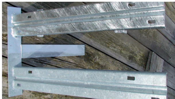
Effet de GalvaSeal après deux semaines (partie supérieure: appliqué sur l'élément; partie inférieure: zingage à chaud normal après deux semaines à l'extérieur).